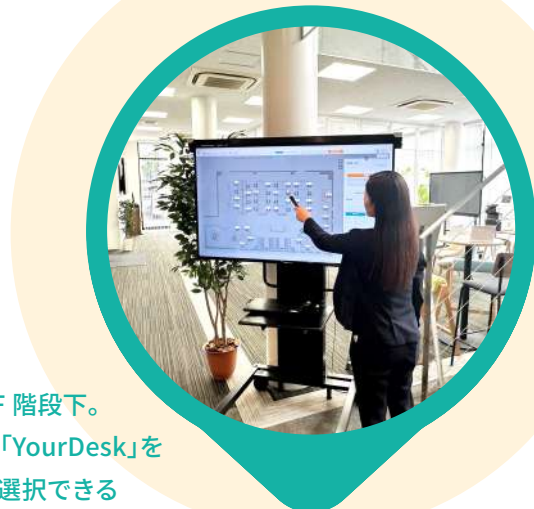
ViCreA 静岡 1F 階段下。 タッチパネルで「YourDesk」を表示し、座席を選択できる