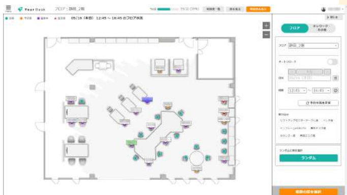
ViCreA 静岡 2F

ViCreA 静岡の2Fは、営業に携わる社員が主に使っており、座席滞在時間が少ないため、座席数を少なくし、スペースを広く使っています。この入口にあるキャビネットの上にはタブレットを設置し、「YourDesk」を表示させています。